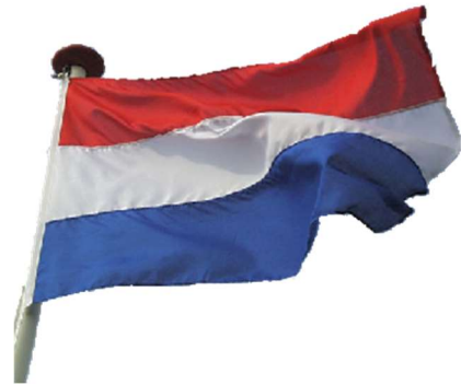
Bemande RC: Nederlandse vlag.