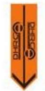
Pijl omlaag: inrijverbod