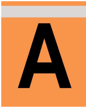
Onbemande RC: Oranje bord waarop zwarte letter.